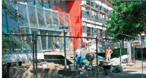
Das neu errichtete, transparent gestaltete Eingangsfoyer wird hell, offen und freundlich zum Schulbesuch einladen.

ßungen auch über einen rollstuhlge- rechten Aufzug zu erreichen. Vom zur alten Schule orientierten Eingangsfoyer des Neubaus aus ist der vorhandene obere Schulhof dann erstmals auch behindertengerecht zugänglich. Das neu errichtete, transparent gestaltete Eingangsfoyer wird hell, offen und freundlich zum Schulbesuch einladen. Das Kostenbudget in Höhe von insge-