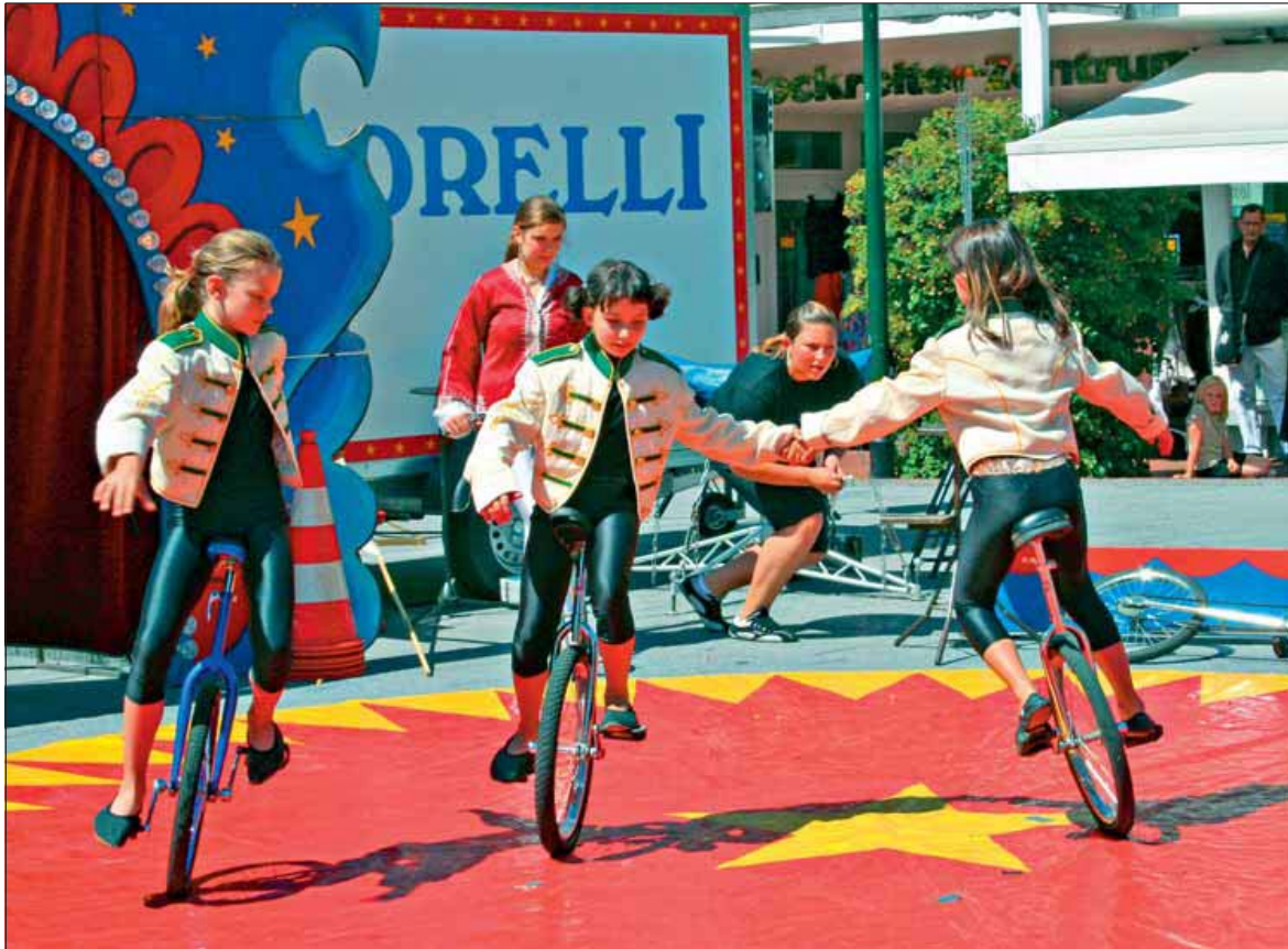
Herzogenrath-Mitte verwandelte sich zum Giroda-Festival in eine große Zirkus-Arena.