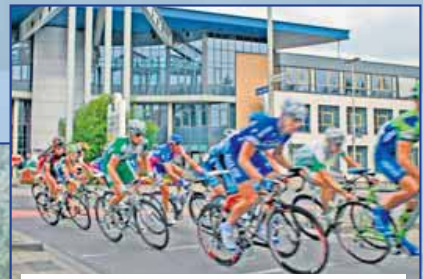
• Radprofis in rasanter Fahrt durch Eurode. Mehr unter: www.enecotour.nl