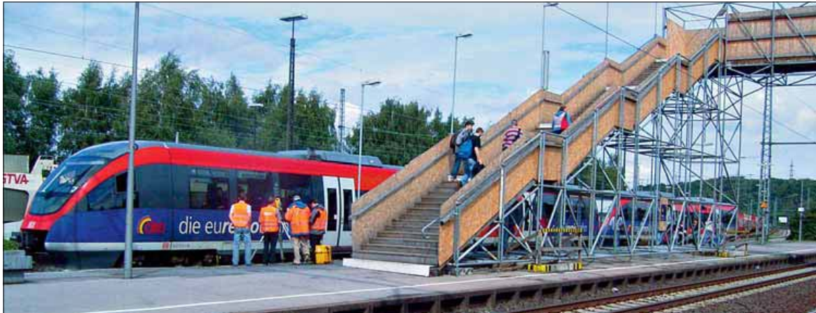
Die Gleise 2 und 3 sind derzeit nur über eine Behelfstreppe mit vielen Stufen erreichbar.