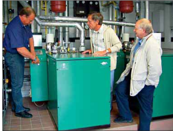
Durch die Sterling-Maschine im Blockheizkraftwerk ist die eigene Energieversorgung sicher gestellt.