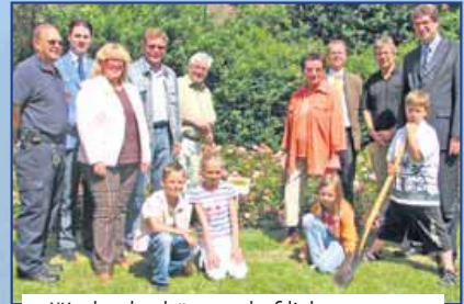
• Woche des bürgerschaftlichen Engagements 2007