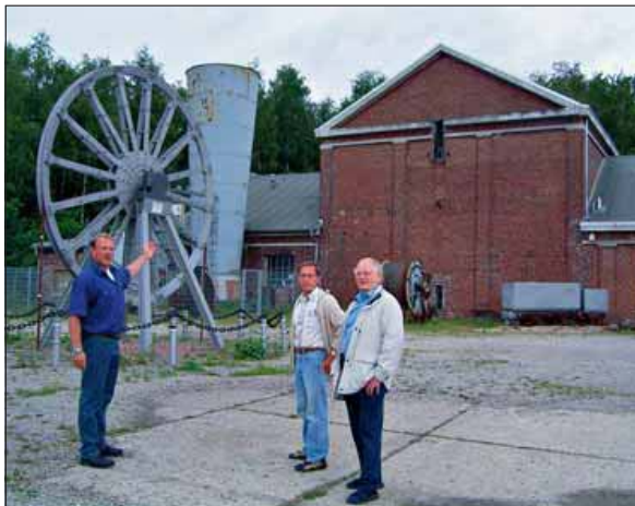
Der Bergbauverein freut sich auf zahlreiche Besucher zum Tag des offenen Denkmals.

Ebenfalls der große Veranstaltungsraum birgt etliche Schätze aus der Bergbau-Ara. Der Tresen, den die ehemaligen Bergmänner - logo - ebenfalls in Eigenarbeit gebaut haben, birgt zahlreiche bergwerkstypische Elemente wie unter anderem ein altes Telefon