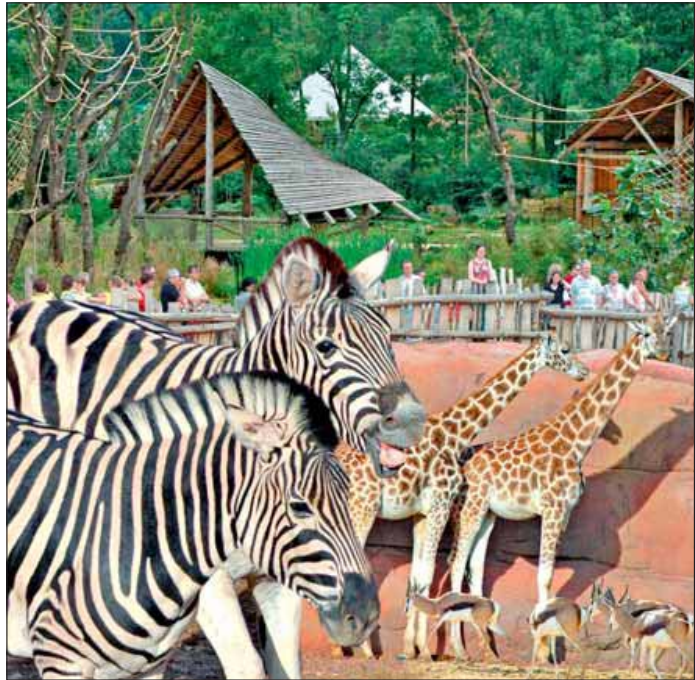
Am Samstag und Sonntag, 22./23. September, öffnet der GaiaPark seine Tore speziell für die Bürger von Eurode.