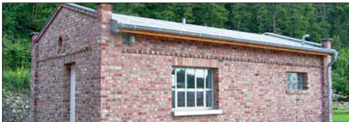
Mit der Errichtung des Kiosks ist die letzte finanzielle Förderphase abgeschlossen.