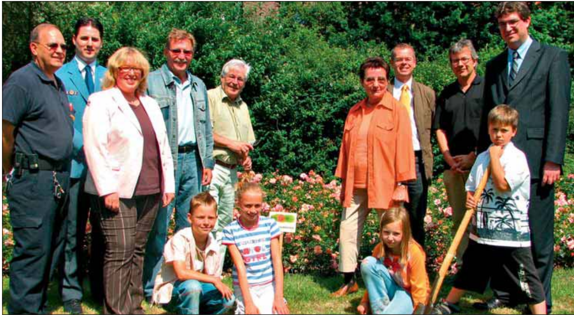
Die Senioren ohne Grenzen und der Seniorenbeirat übernehmen im Rahmen des vom Stadtmarketing e.V. initiierten Verschönerungswettbewerbs die Patenschaft für ein Rosenbeet in Alt-Merkstein.