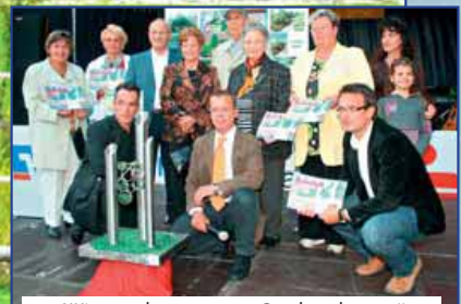
• „Wir machen unsere Stadt schöner“

Tag des offenen Denkmals am 16. September Besucherzentrum Fördermaschinenhaus Grube-Adolf-Park eröffnet