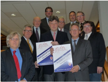
Liebe Mitbürgerinnen, liebe Mitbürger!