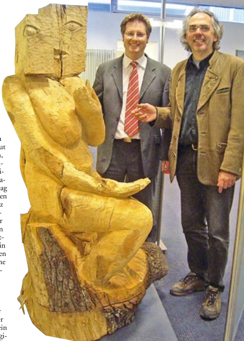
Auch in der Sparkasse in Herzogenrath-Mitte stellt der Verein gelegentlich aus.

Der Kunstverein plant unter anderem mit Schülern der Realschule in Kohlscheid ein Kunstprojekt im Bereich digitaler Fotografie sowie eine euronale Gruppenausstellung mit deutschen, belgischen und niederländischen Künstlern. „Unser Hauptaugenmerk werden wir natürlich auf die große Eröffnungsausstellung im No-