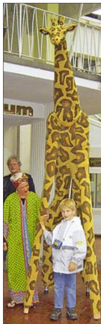
Die Giraffe war bereits in 2004 in Herzogenrath zu Besuch und soll 2006 ins Girodaland zurückkehren.