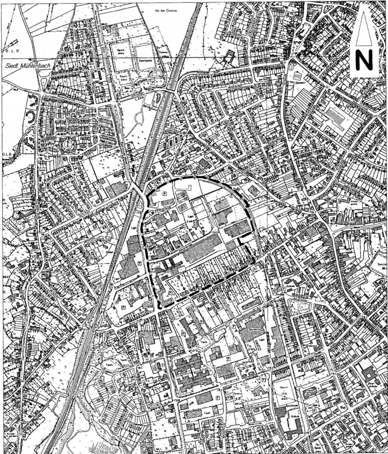
Auszug aus der deutschen Grundkarte