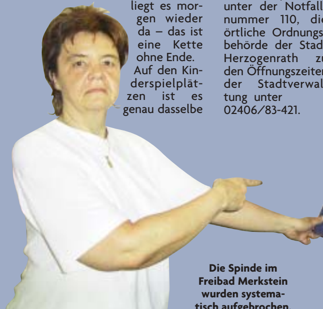
Die Spinde im Freibad Merkstein wurden systematisch aufgebrochen.