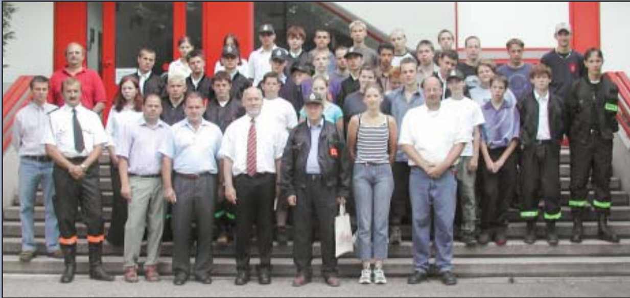
Die Zusammenkunft polnischer und deutscher Jugendfeuerwehren soll Basis für engere Kontakte werden.

zogenrath: „Vor zwei Jahren haben wir den Kontakt zu der polnischen Wehr aufgenommen. Im letzten Jahr hatten wir einen tollen Empfang im Zeltlager in Przechód. Bei dieser Gelegenheit haben wir viele nette Leute kennen gelernt, Freundschaften geschlossen, interessante Städte besichtigt. Die Kommunikation ist bei uns kein Problem – wir gehen alle aufeinander zu.“