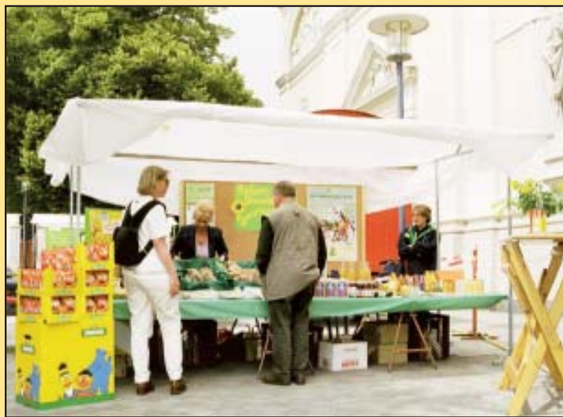
Viele Besucher informierten sich umfassend zum Thema Umweltschutz.

Die Erlöse aus dem Verkauf werden den Opfern des „Super-GAU Tschernobyl“ gespendet. Umweltclowns, mittlerweile gute alte Bekannte beim Herzogenrather Umwelttag, nahmen die Besucher mit auf eine spannende und musikalische Umweltreise. Auch das