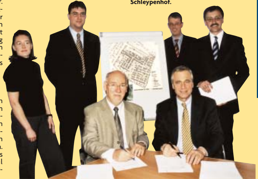
Strahlende Gesichter bei der Vertragsunterzeichnung zum Großprojekt Schleypenhof.

Im Bereich Schleypenhof soll nun ein Wohngebiet entstehen, das heutigen städtebaulichen und ökologischen Anforderungen genügt und in diesen Bereichen ausgewiesene Qualitäten aufweist. Ziel der Stadt Herzogenrath ist, den Bedarf an kostengünstigem Wohnraum primär für junge Familien durch ein Angebot unterschiedlichster Grundstücksgößen zu decken. Vorgesehen ist die Errichtung von ca. 175 Wohneinheiten als Einzel-, Doppel- und Reihenhäuser.