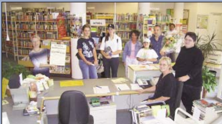
Das Team der Stadtbücherei Herzogenrath, die in diesem Jahr ihr 25-jähriges Bestehen feiert