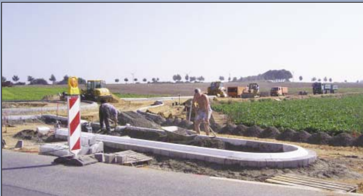
Die Arbeiten an der L 240n sind in vollem Gange. Nach Fertigstellung wird Merkstein leichter zu erreichen sein.